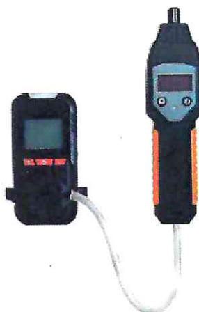
е) модификация HardGas S1 с внешним пробоотборным насосом