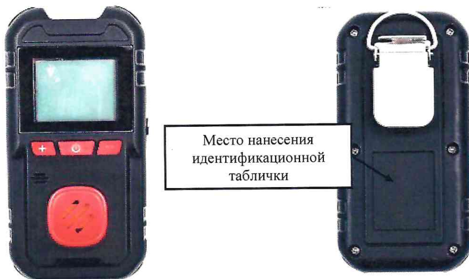
г) модификация HardGas S1