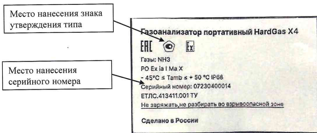
Рисунок 2 – Идентификационная табличка