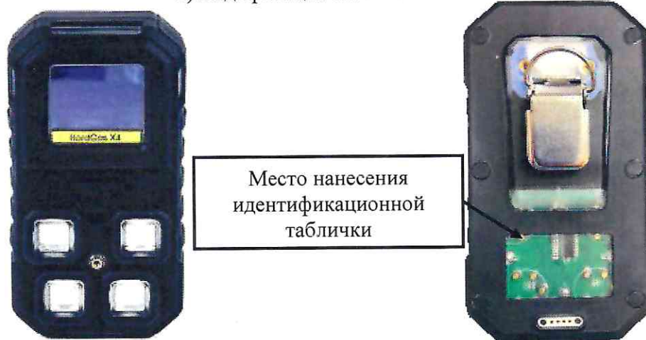
б) модификация HardGas X4