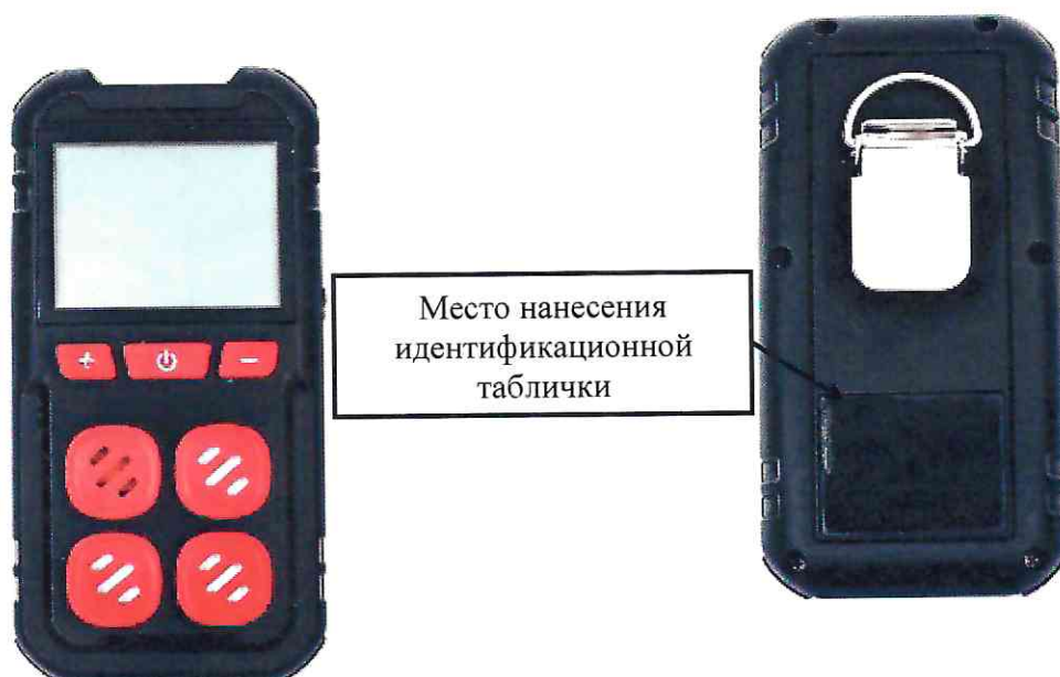
д) модификация HardGas S4