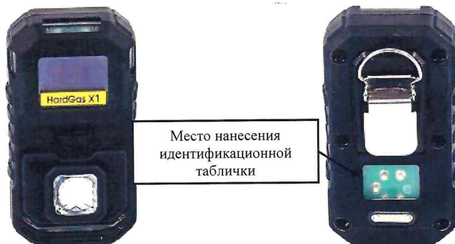
а) модификация HardGas X1