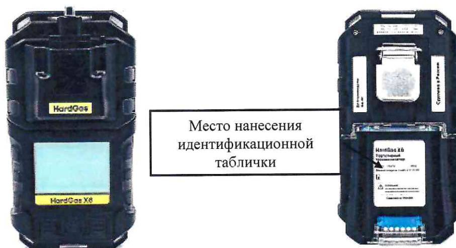
в) модификация HardGas X6