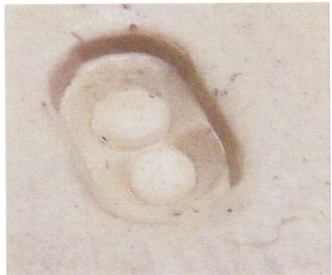
б) вид пломбы